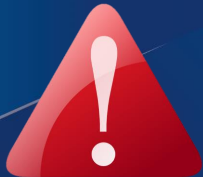
TABLEAU DES EQUIVALENCES